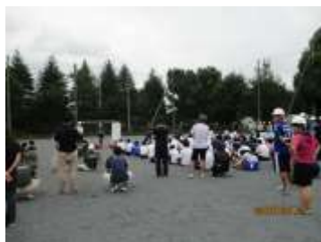
グラウンドへ避難

そして、9月11日（火）に全校一斉の防災避難訓練、その後、1年生は防災教育として消火器操作の学習、煙体験を実施しました。生徒は皆グラウンドへ落ち着いて、速やかに避難することができました。今回は4月の第1回目に続き、2回目ということで、誰にも指示をされることなく、自ら判断して身を守ることができるようになることを目標としました。大地震が起きたら『落ちてこない・倒れてこない・移動してこない』場所に」移動することが身を守ることにつながることを事前に学習しました。上からもものが落ちてこない、横からもものが倒れてこない、ものが移動してこない場所に素早く移動する意識を、日ごろから高めていくことが大切です。