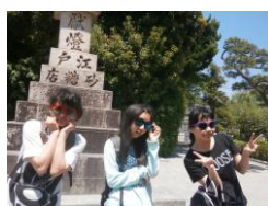
お揃いのサングラス