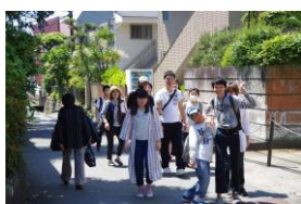
銭洗弁財天への道中